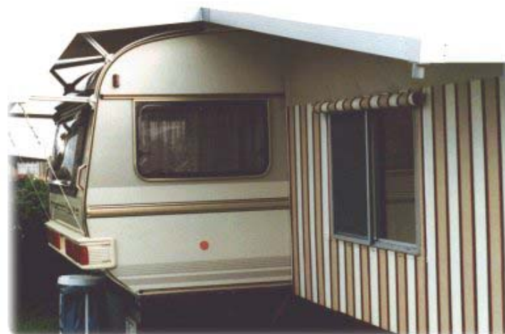
Standvorzelt (Teilzelt) mit integriertem Schutzdach

Kommen Sie mit Ihren Ideen zu uns. Wir helfen Ihnen und konstruieren Ihnen Ihr Veltel-Vorzelt mit integriertem Schutzdach so wie Sie es brauchen!