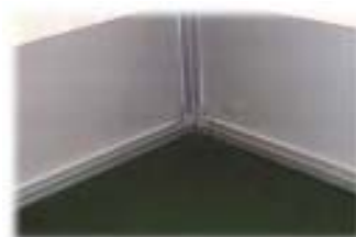
Abspannung mit Profilen

Eine weitere Möglichkeit für die Befestigung am Boden, die zusätzliche Stabilität bietet, sind rundumlaufende Profile in Bodennähe (selbstverständlich auch mit Keder eingezogen), mit denen die Wand nach unten gespannt werden kann.