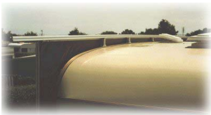
... und von hinten

zwischen Wohnwagen und Rahmen wird mit einer Plane ausgefüllt, die übrigens in Kederschiene des Wohnwagens eingezogen ist und nicht einfach mit Wohnwagen oder Rahmen verklebt wird.