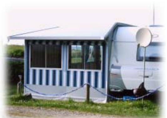
Standvorzelt freistehend mit Umbauung