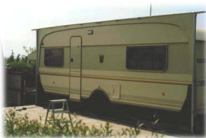
Umbauung des Wohnwagens von vorn ...