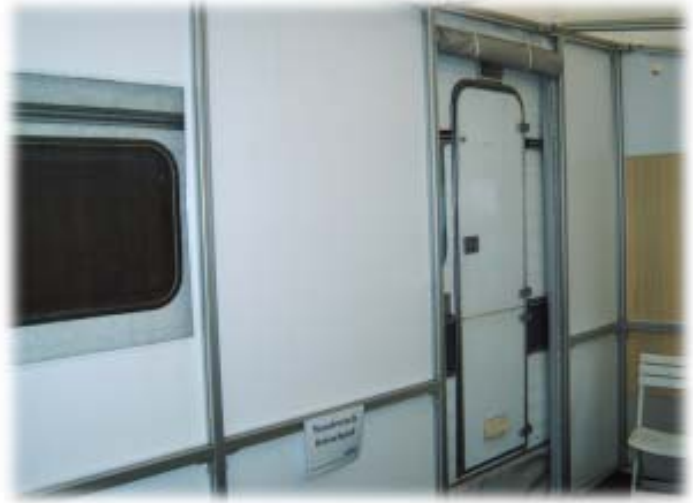
Standvorzelt freistehend mit Rückwand

Ein freistehendes Vorzelt macht dann Sinn, wenn Sie mit Ihrem Wohnwagen auch reisen wollen oder aber am Wohnwagen nichts anschrauben wollen. Wir können Ihnen für beide Fälle eine maßgeschneiderte Lösung anbieten: entweder mit Rückwand und einer Tunnelverbindung, oder mit einer Umbauung (diese Version ist dafür geeignet, später ein Schutzdach über den Wohnwagen zu integrieren).