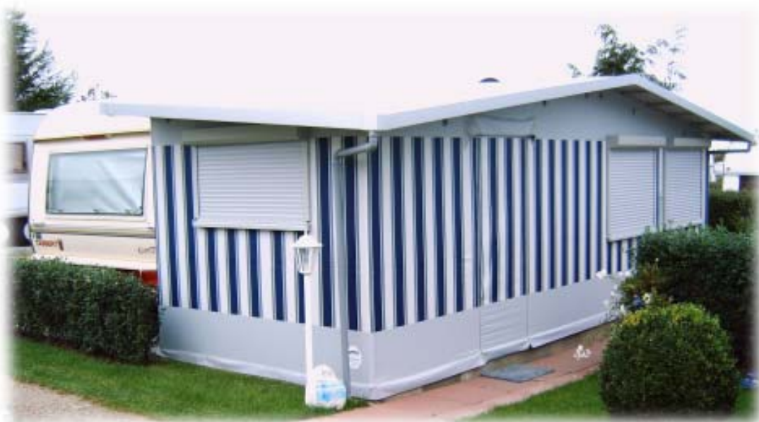
Schiebefenster und Kippfenster mit Rollladen

In die Seitenwänden des Vorzeltes, die in die Kederschiene des Wohnwagens eingezogen sind, ist es normalerweise nicht möglich, feste Türen oder Glasfenster einzubauen. In diesem Fall erhält das Standvorzelt auf dieser Seite einen kleinen Anbau (ca. 10 cm) oder wir umbauen den Wohnwagen ganz oder teilweise mit einem Rahmen, so daß Sie eine ebene Seitenwand erhalten, in die dann Glasfenster bzw. feste Türen eingebaut werden können (vgl. die nähere Beschreibung im Abschnitt „Das Veltel-Konzept“).