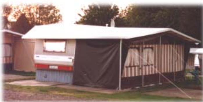
Schutzdach über Wohnwagen und Vorzelt