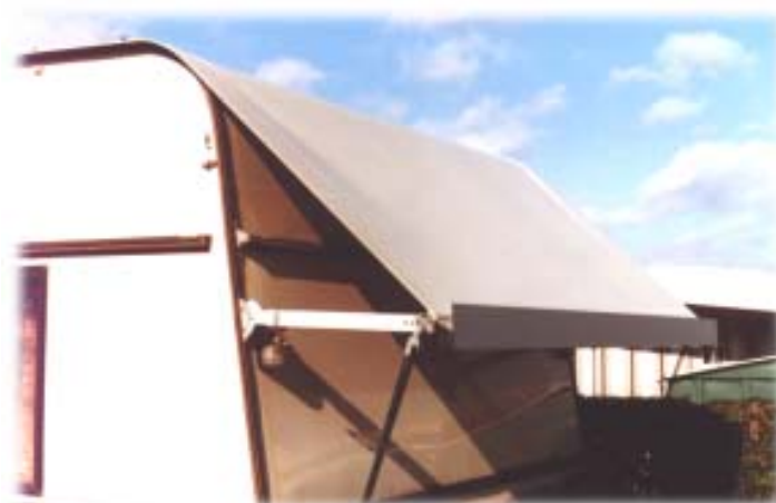
Protec-Spezial (mit Schutzdachrinne)

Die Montage erfolgt entweder bei uns im Werk oder auf Ihrem Campingplatz.