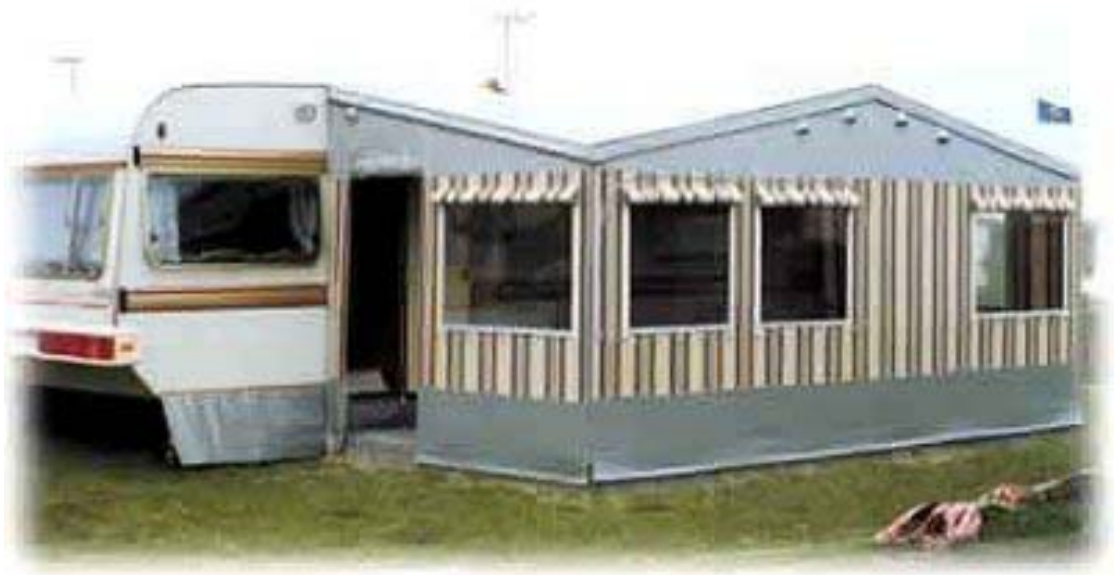
Standvorzelt ohne Dachüberstände

Veltel-Standvorzelte (mit Gerüsten aus Alu-4-T-Nut Profilen) sind unser Angebot für Camper, die ihre Vorzelte im Winter nicht abzubauen brauchen. Im Vordergrund stehen also Stabilität, Komfort und Qualität .