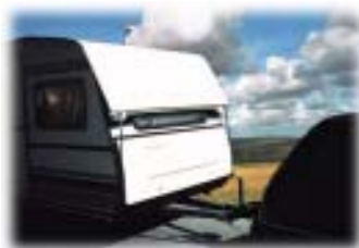
Protec-Swiss in Fahrposition

Die Umstellung von der Stand- auf die Fahrposition erfolgt mit wenigen Handgriffen. Durch die stabile Verspannung ist das Dach auch während der Fahrt völlig sicher. Die Vorschriften der Straßenverkehrs Zulassungsordnung