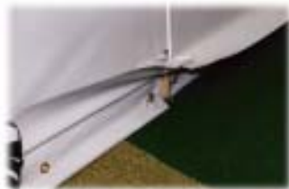
Saum mit Ösen

Wichtig für die Qualität ist auch die Befestigung des Zelttes am Boden. Sie haben die Wahl zwischen mehreren Möglichkeiten, wie die Seitenwände am Fußboden befestigt werden können. Standardmäßig liefern wir einen abgedeckten Saum mit Ösen, durch die die