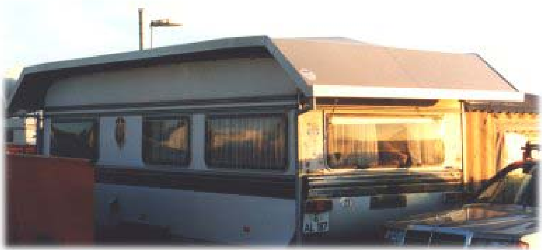
Schutzdach über Wohnwagen

Die Dachluken können auch bei Regen oder Schneefall geöffnet werden. Für Abgaskamin und Antenne werden bei der Montage Verlängerungen und Durchbrüche eingebaut. Übrigens: Veltel-Schutzdächer können problemlos demontiert und ggf. für einen anderen Wohnwagen (evtl. mit Änderung) verwendet werden.