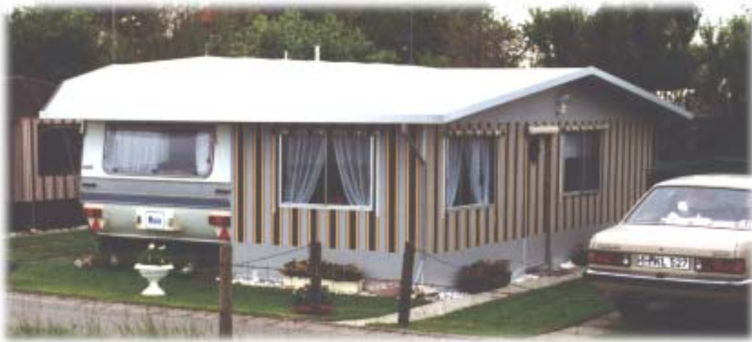
Standvorzelt mit integriertem Schutzdach

Eine sehr schöne Möglichkeit, die Einheit von Veltel-Vorzelt und Wohnwagen zu betonen ist, das Zeltdach mit einem Schutzdach für den Wohnwagen zu integrieren. Schutzdach und Zeltdach sind dann eine Plane. Auch hier haben Sie viele Gestaltungsmöglichkeiten: das Zelt muß nicht notwendigerweise so groß sein wie der Wohnwagen, auch Anbauzelte oder Teilzelte sind möglich. Der restliche Platz vor dem Wohnwagen kann dann entweder als Terrasse frei bleiben oder auch überdacht werden.