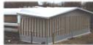
Außenklappen rapportgetreu im Streifendessin

Und: ob Türen oder Außenklappen, alles wird rapportgetreu im Streifendessin (und nicht etwa uni) gefertigt.