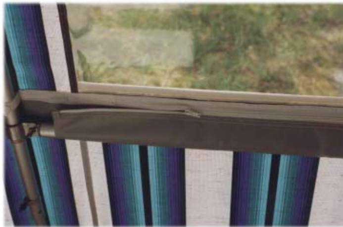
Reißverschlussaschen für Sturmgestänge