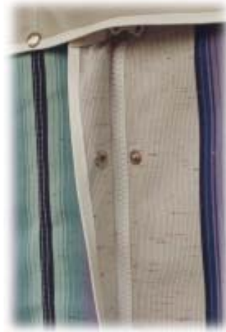
Reißverschlüsse abgedeckt mit Druckknopffallen