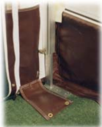
Doppelter Bodenstreifen mit gesäumtem und geöstem Erdstreifen (innenliegend)